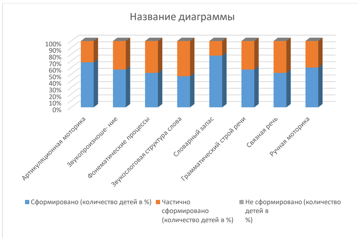
Таблица мониторинга речевого развития детей подготовительной к школе группы компенсирующей направленности за 2022-2023 учебный год (итоговый мониторинг)